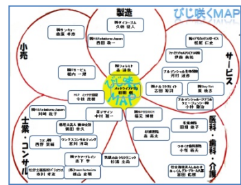
↑一昨年のびじ咲くMAP(地域別)